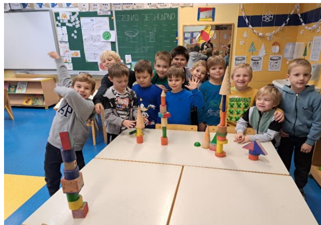
TO SMO PA MI