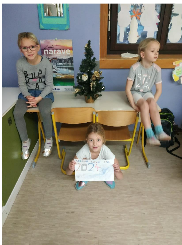
UČENCI IN UČITELJICE OŠ ŠKOFJA LOKA - MESTO